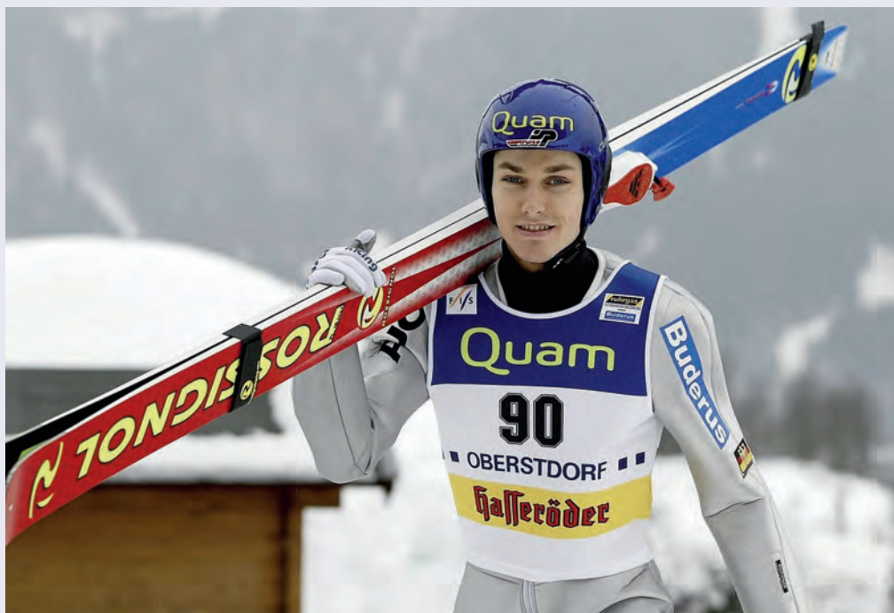
Einer von vielen: Skispringer Sven Hannawald fühlte sich ausgebrannt und ständig voller Unruhe, im Jahr 2005 verabschiedete er sich vom Leistungssport